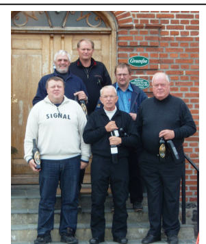
Medhjælpermatchens dygtige vindere

Dagen sluttede med smørrebrød og forfriskninger.