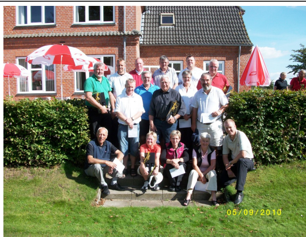
RC Beton-matchens glade præmietagere samlet på terrassen til klubhusets terrasse

I forbindelse med præmieuddelingen blev serveret et let traktement